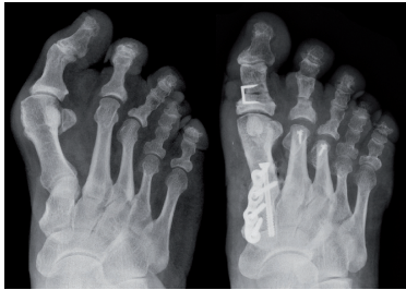
Komplexe Vorfußkorrektur bei Hallux valgus, Brachimetatarsie und Hammerzehe