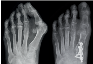
Hallux valgus Korrektur durch Lapidus-Arthrodesis